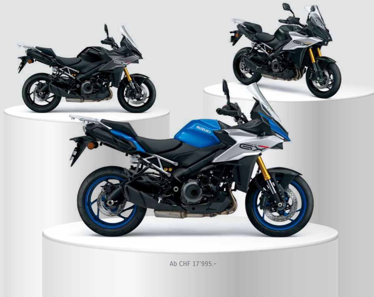
Ab CHF 17'995.-

Ride-by-Wire ✦ Low-RPM Assist System ✦ Easy Start System ✦ Quickshifter mit Blipper Funktion ✦ Smart Cruise Control ✦ Traktionskontrolle ✦ Suzuki Drive Mode ✦ Selector Alpha (SDMS-a) ✦ Kurven-ABS ✦ Hill Hold Control System ✦ Slope Dependent Control System ✦ Load Dependent Control System ✦ TFT Farbdisplay Connectivity Suzuki mySpin ✦ USB-Steckdose ✦ SUZUKI Road Adaptive Stabilization (SRAS) ✦ Automatic Rear Suspension Modes